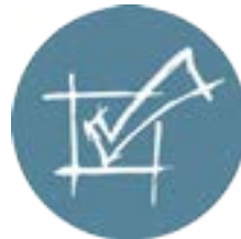
Qualidade, Ambiente, Responsabilidade Social, Segurança, Higiene e Saúde no Trabalho