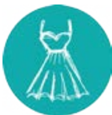
Têxtil e Vestuário