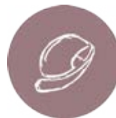
Construção e Engenharia Civil