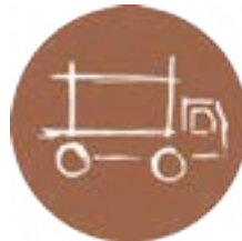
Transporte e Manuseamento de Equipamentos