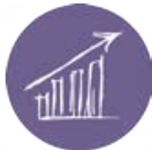
Marketing e Vendas