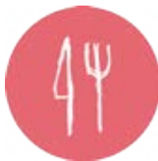
Hotelaria e Restauração