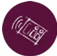
Gestão e Operações