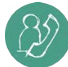
Secretariado e Gestão Administrativa