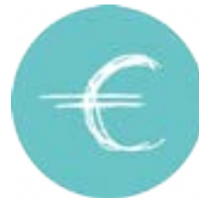
Gestão Financeira, Contabilidade, Fiscalidade e Direito laboral