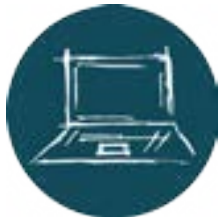
TIC - Tecnologias de Informação e Comunicação