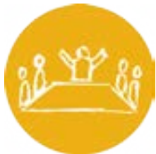
Liderança e Gestão Comportamental